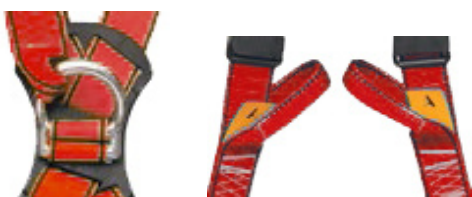
Punto anclaje dorsal