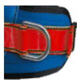
Punto anclaje lateral de cinturón para posicionamiento