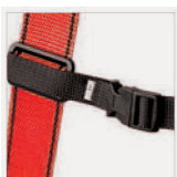
Hebilla de conexión y regulación