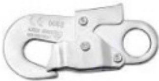
Conector 2 Modelo AA 002