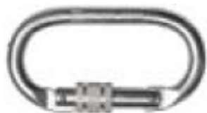
Conector 1 Modelo AA 011