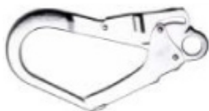
Conector 3 Modelo AA 022