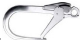
Conector 5 Modelo AA 024