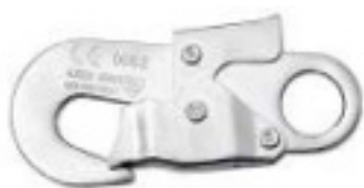
Conector 2 Modelo AA 002