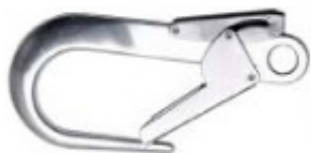
Conector 4 Modelo AA 023