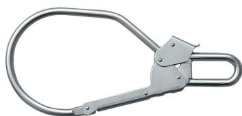
Conector 6 Modelo AA 025