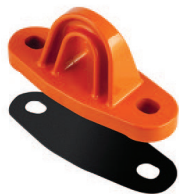
Goma de apoyo PAF 150S para Punto de Anclaje PAF 150 (Opcional)