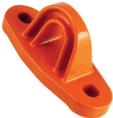
Punto de anclaje fijo para personas PAF 150