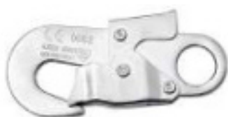
Conector 2 Modelo AA 002