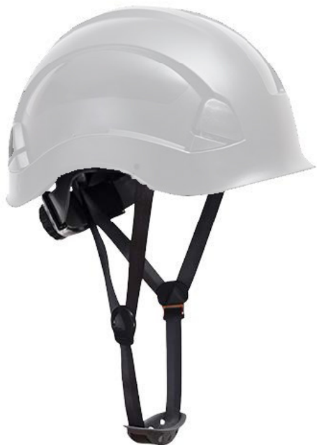
Casco AEL blanco

CASCO BLANCO PARA TRABAJOS EN ALTURA mod. AEL: