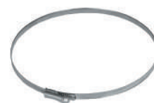
Abrazadera para EM 11 Ref. EM 11410