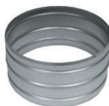
Conector para EM 11 Ref. EM 11310