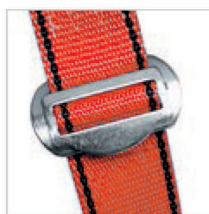
Hebillas de conexión-regulación