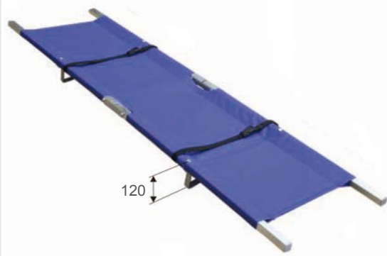
Camilla CR 10ALU abierta