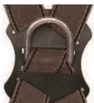
Punto anclaje dorsal