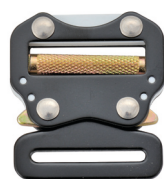
Hebillas de cierre automático