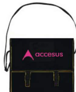
Bolsa de transporte cerrada de la LVH 300-20+CONECTORES