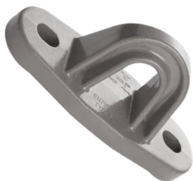
Punto de anclaje fijo para personas PAF150 GRIS