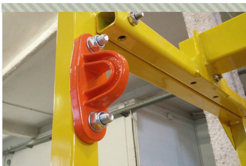
Detalle de PAF150 en cesta para grúas CG300